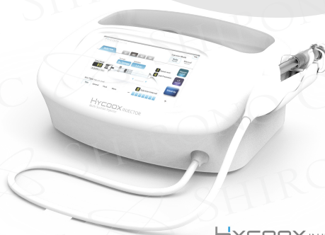
HYCOOX INJECTOR Multi Suction Injector

建议每隔2~3周进行一次治疗，连续治疗3~5次为一个疗程。治疗后可能会出现针眼或皮下出血现象，此类症状大多会在数日至一周左右自行消退。