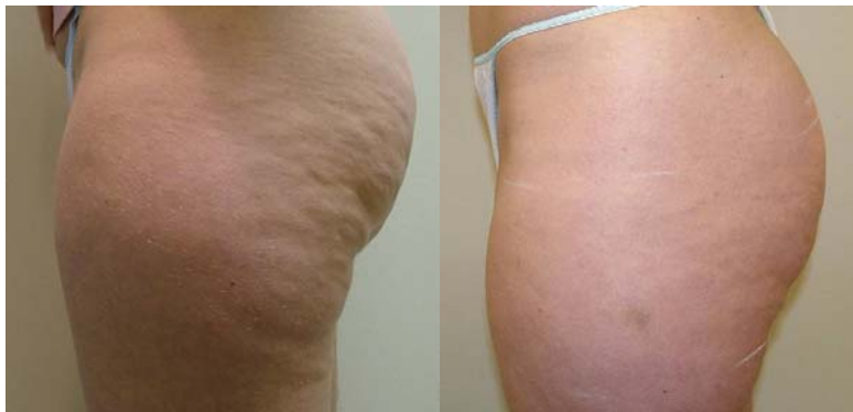
■ 5回施術《 太もも&ヒップ 》