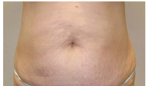
■ 7回施術《 腹部 》