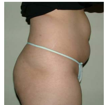
■ 7回施術《 腹部&ヒップ 》