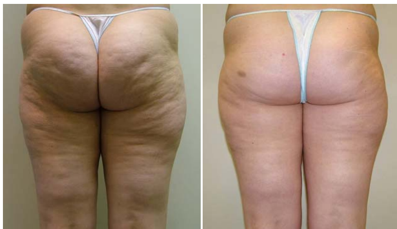
■ 7回施術《 ヒップ&太もも 》